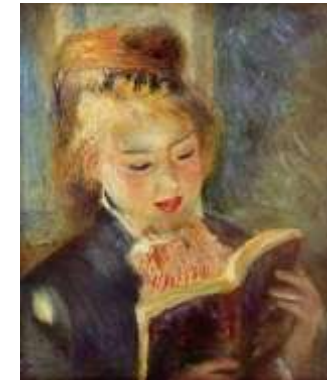
La liseuse Pierre-Auguste Renoir